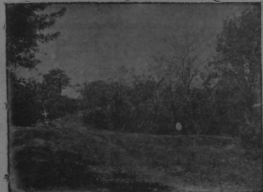
(a) Lugar donde cayó muerta Silvia (b) En la calle y en esa dirección, fue encontrada la viuda de Silvia.