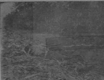
Posición en que fue encontrado el cadáver de Silvia