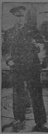
EL ALMIRANTE FLETCHER

cuya solicitud del Gobierno Americano de que envíe marinos para desembarcar en México, ha causado gran excitación en este país, actitud aquella de Mr. Fletcher que también ha sido comentadísima por la prensa mundial.